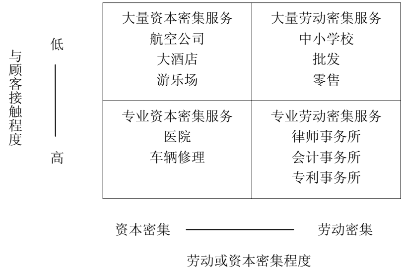
图 1—3 按劳动密集程度和与顾客接触程度对服务业分工

按劳动密集程度和与顾客接触程度可将服务运作分成四种： 大量资本密集服务、专业资本密集服务、大量劳务密集服务和专业劳务密集服务 ，如图 1—3 所示。