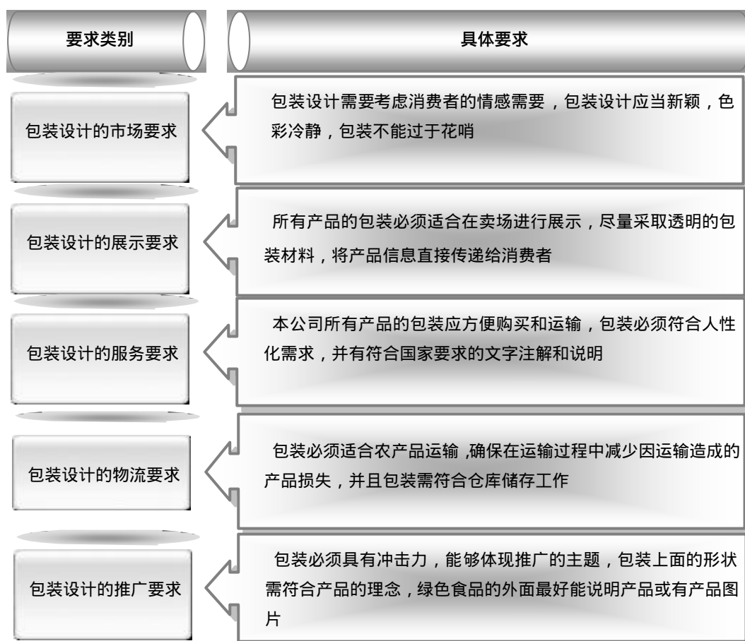
包装设计要求说明图