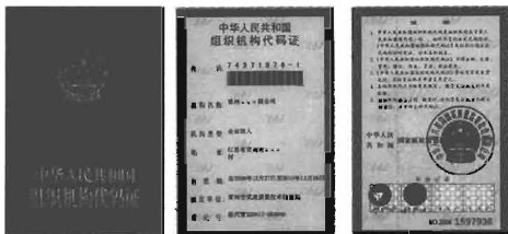
图 10-1 组织机构代码证

代码证是由国家质量监督检验检疫总局统一印制的，采用了以下防伪措施：一是采用了专用水印纸；二是印刷了防涂改底纹；三是套印了荧光防伪油墨印制的国家质量监督检验检疫局行政章（见图 10-1）。