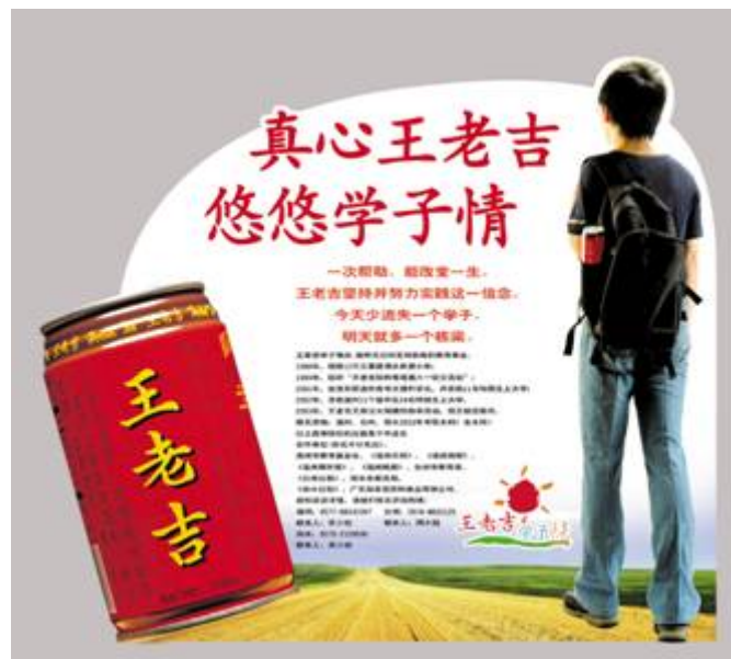
王老吉学子情活动

在频频的消费者促销活动中，同样是围绕着“怕上火，喝王老吉”这一主题进行。如在一次促销活动中，加多宝公司举行了“炎夏消暑王老吉，绿水青山任我行”刮刮卡活动。消费者刮中“炎夏消暑王老吉”字样，可获得当地避暑胜地门票两张，并可在当地渡假村免费住宿两天。这样的促销，既达到了即时促销的目的，又有力地支持巩固了红罐王老吉“预防上火的饮料”的品牌定位。